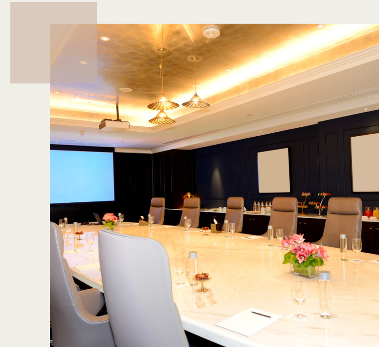
Salas de reunión