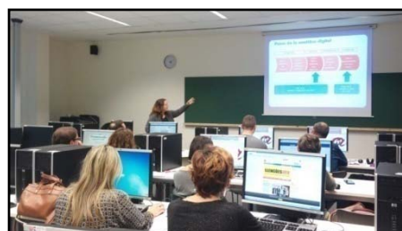
Imágenes del taller formativo celebrado en Vila-seca, fotografía superior, y en Tortosa.