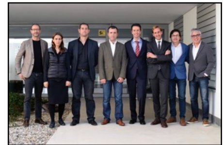
En la fotografía superior, una imagen de la bienvenida a la jornada.