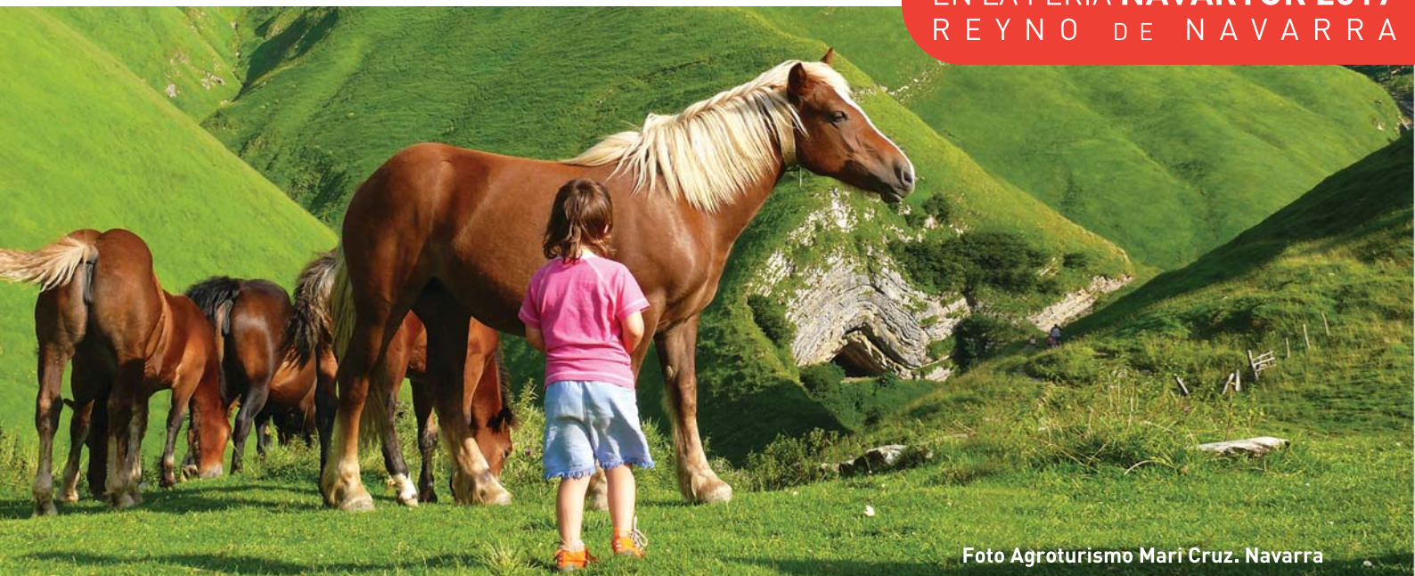
Foto Agroturismo Mari Cruz. Navarra

EN LA FERIA NAVARTUR 2017 REYNO DE NAVARRA